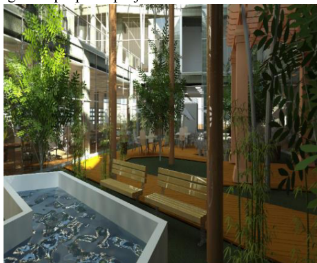
Figura 2 – Espelho d'água da proposta projetual do Contact Center .

A exemplo disso, pode-se citar a pesquisa desenvolvida por Paula et. al. , (2019), em que os autores realizam uma proposta projetual de uma edificação corporativa conhecida como Contact Center para o município de Brasília – DF.