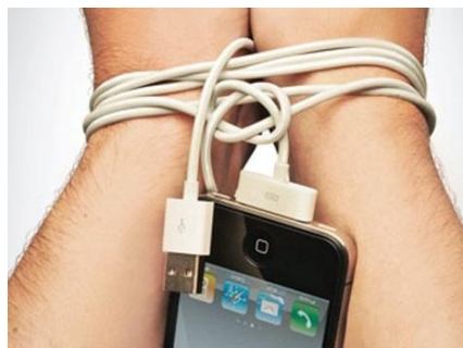
Figura 4 – Representação de dependência dos dispositivos móveis

Com a forte e concorrente industrialização e a proliferação em massa dos Tablets e Smartphones – os “dispositivos móveis”, logo o mercado estava carregado de modelos, com preços variados e opções para todos os gostos. Assim iniciava, gradualmente, novos hábitos que, pelas facilidades e novidades constantes no lançamentos de app 's, prometiam nos entreter e facilitar nossas vidas, mas também estavam ocorrendo outro fato em paralelo: o uso excessivo dos dispositivos móveis.