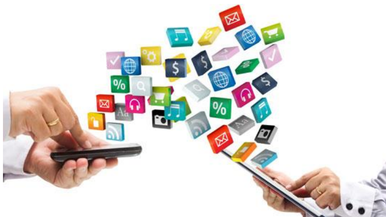
Figura 9 – Os dispositivos móveis e seus atraentes aplicativos.

Juntando o poder cativante das redes sociais à praticidade dos dispositivos móveis, chegamos a um resultado visivelmente devastador: uma imensa quantidade de pessoas, a qualquer hora e em qualquer lugar, com a atenção voltada quase que exclusivamente às pequenas telas dos dispositivos (figura 9).