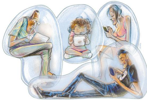
Figura 1 – Caso típico do efeito dentro da família.

Os maiores empresários que se destacaram perante à sociedade tiveram que promover contatos que, na maioria das vezes, foram pessoais. É claro que usavam telefones e cartas para suas comunicações, mas o contato pessoal é algo muito forte no mundo dos negócios.