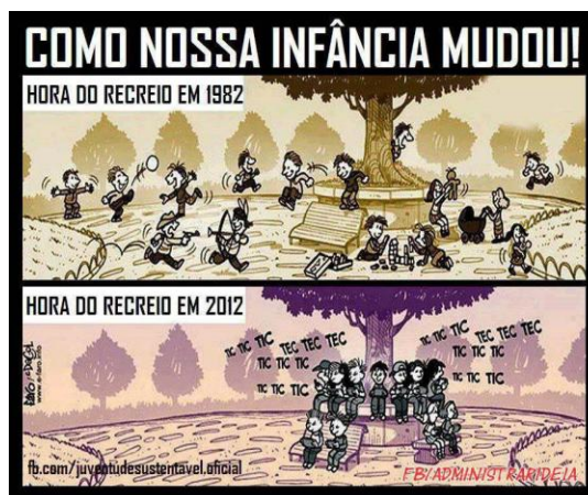
Figura 6 – Representação de comportamento em diferentes épocas

décadas atrás, quando ainda não havia a invasão dos eletrônicos portáteis na vida das crianças e dos adolescentes (figura 6).