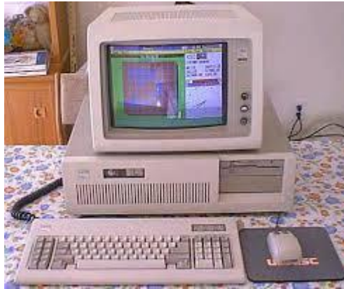
Figura 3 – PC-AT muito popular no início dos anos 90.

No início do novo século, após o grande temor do famoso “ bug do milênio” (todos temiam perder seus imensos dados armazenados digitalmente), proliferaram os computadores mais velozes e com maior capacidade de memória e armazenamento, com multimídia on-board (integrado à placa-mãe) e melhores condições ao acesso à internet de forma mais rápida, eficaz e a qualquer hora. Os fabricantes de notebooks (os antigos lap-tops ) melhoraram seus projetos, propiciando equipamentos menores, mais estéticos e – principalmente – mais baratos, incluindo facilidades para a aquisição de novos equipamentos. O gosto pela portabilidade estava se consolidando entre os usuários do mundo inteiro, fazendo com que a procura de desktops (“ PC’s ” ou computadores de mesa) fosse superada por maiores aquisições de notebooks . Devido à grande procura pelos novos eletrodomésticos – isso mesmo, os diversos computadores ( desktops e notebooks ) foram vendidos, não apenas pelas lojas especializadas do setor de informática, mas também pelas grandes redes de lojas de departamentos e, progressivamente, pelas lojas de varejo menos consolidadas do setor.