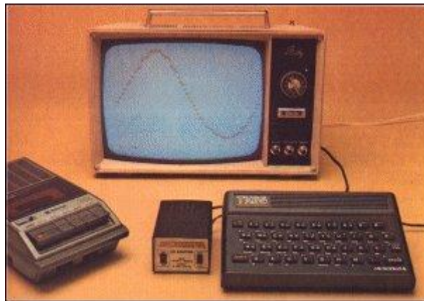
Figura 2 – Típico microcomputador 8 bits anos 80, com TV e gravador K7.

Se não tivessem inventado a interface gráfica para o usuário (GUI), provavelmente os computadores ainda seriam alvo de entusiastas e interessados na área da informática. Poucas pessoas se interessavam em ficar digitando linhas de comando para cada operação necessitada. Mas não foram apenas os usuários comuns que se beneficiaram de tal avanço tecnológico, os programadores passaram a usar as IDE's intuitivas que auxiliam todo o processo de desenvolvimento de um software , ou em um termo mais atual, um aplicativo ( app ).