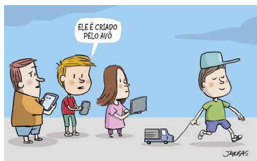
Figura 5 – Crianças devem ser orientadas sobre o uso de dispositivos móveis

Desde cedo é primordial uma devida orientação aos mais jovens com relação aos dispositivos móveis e a própria internet (figura 5).