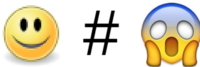
Figura 7 - Emoticon, Cerquilha e Emoji.